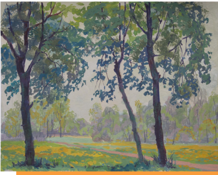
Arbres dans le parc, gouache sur papier, 29.7 x 42 cm - Olga Kataeva-Rochford

Fabrication d'un carnet de voyage à partir des croquis, peintures et nuanciers réalisés pendant le stage (leporello, reliure japonaise)